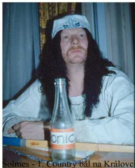
Solmes - 1. Country bál na Královci