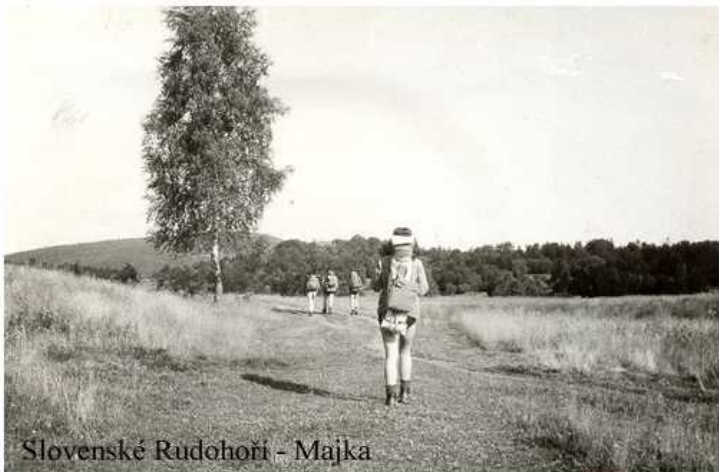
Slovenské Rudohori - Majka