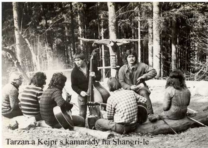
Tarzan a Kejpr s kamarády na Shangri-le