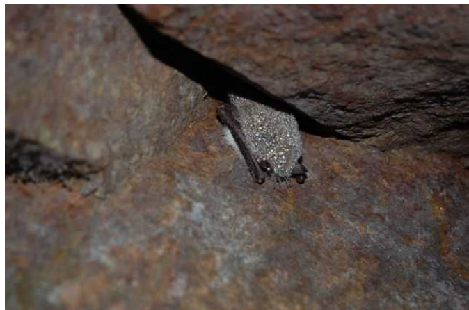
netopier vodný ( Myotis daubentoni )