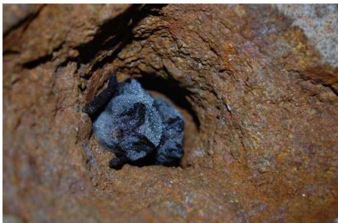
netopier veľký ( Myotis myotis )