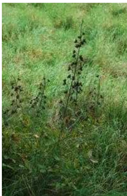
Odkvitnutý Jasenec biely

Na Holubyho lesostepi vyskytuje 280 druhov vyšších rastlín z toho 240 druhov bylín a 40 druhov stromov a krov. Nachádzajú sa tu aj chránené, vzácne a ohrozené druhy rastlín. Z nich treba spomenúť poniklec lúčny čiernastý ( Pulsatilla pratensis ssp.: nigricans ),