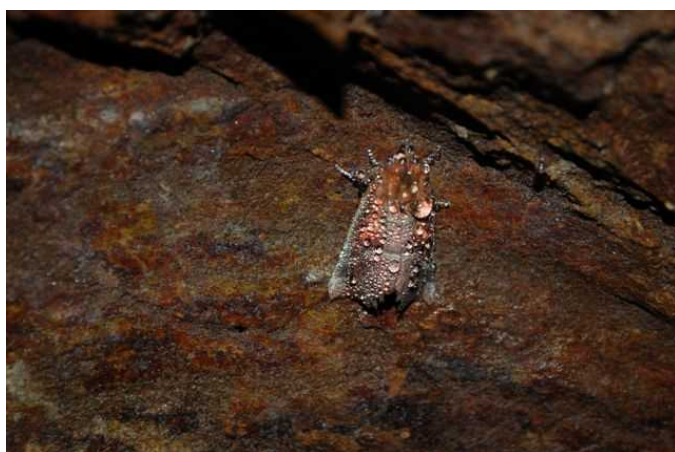
Mora pivničná ( Scoliopteryx libathrix ).