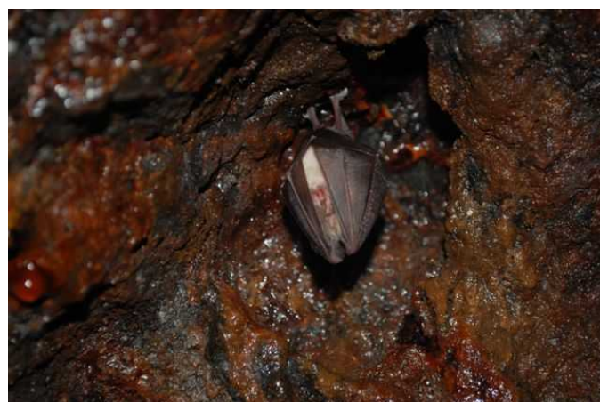
Podkovár krpatý ( Rhinolophus hipposideros )