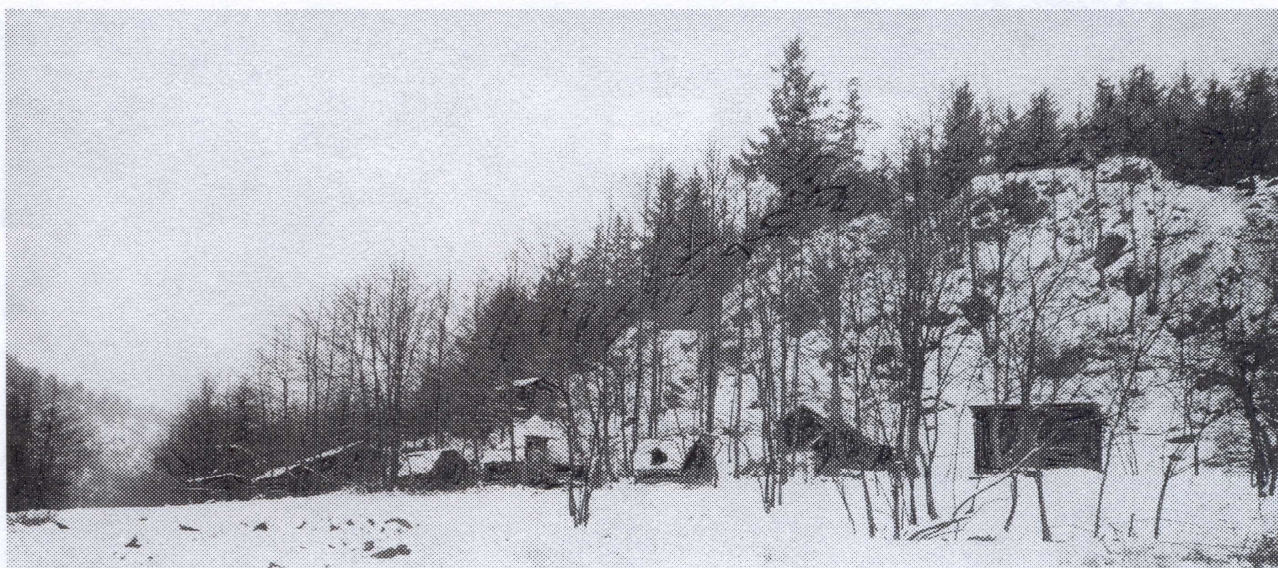
První chaty na Ztracence pod Mravenčí skálou (1923)