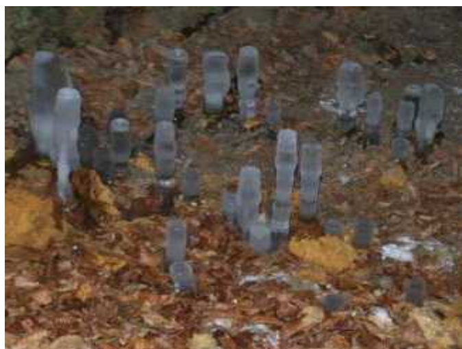
Vstup do štôlne skrášlený ľadovými stalagmitmi

© Vydáva Regionálne trampské združenie – Pezinok pre vnútornú potrebu združenia. Spolupracovali kamaráti : Gula, Rendy, Lewis, Bublina, Ud'o, Kejpr a ďalší. Predpokladaná uzávierka budúceho čísla 25.05.2011. kontakt: www.rtzpezinok.tym.sk , www.malokarpatskyvobcasnik.tym.sk