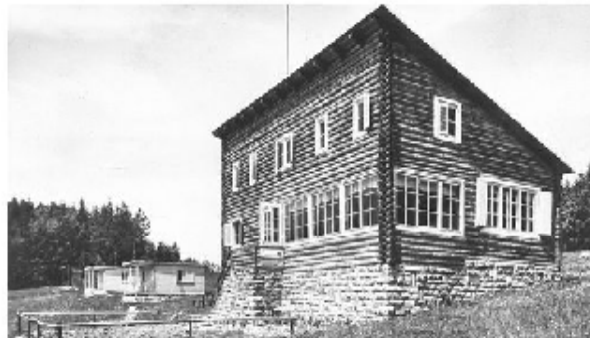
Chata na Královci - občerstvovací stanice trampů postavená r.1936, vyhořela z 24.12. na 25.12. 1959