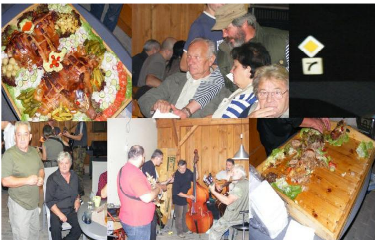
Posedenie pri pečenom prasiatku hudbe – Budmerice 2011.