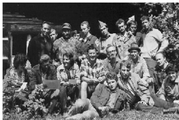
Z prvního potlachu klobuckých trampů na Javorůvkách u chaty Shangri-la r.1966