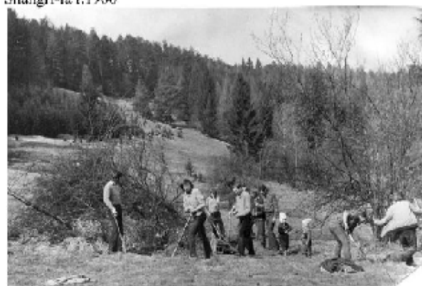
Členové Tisu (Svaz ochránců přírody) při sázení stromků na Javorůvkách r.1975