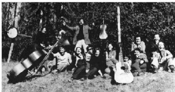
Klubečtí trampí na Javorůvkách r.1974