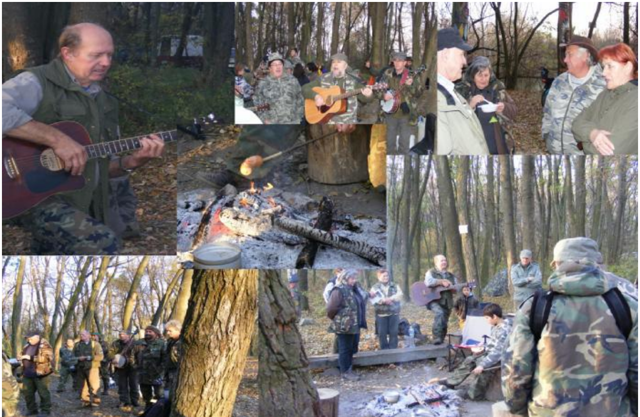
Jesenné táborenie 12.11.2011