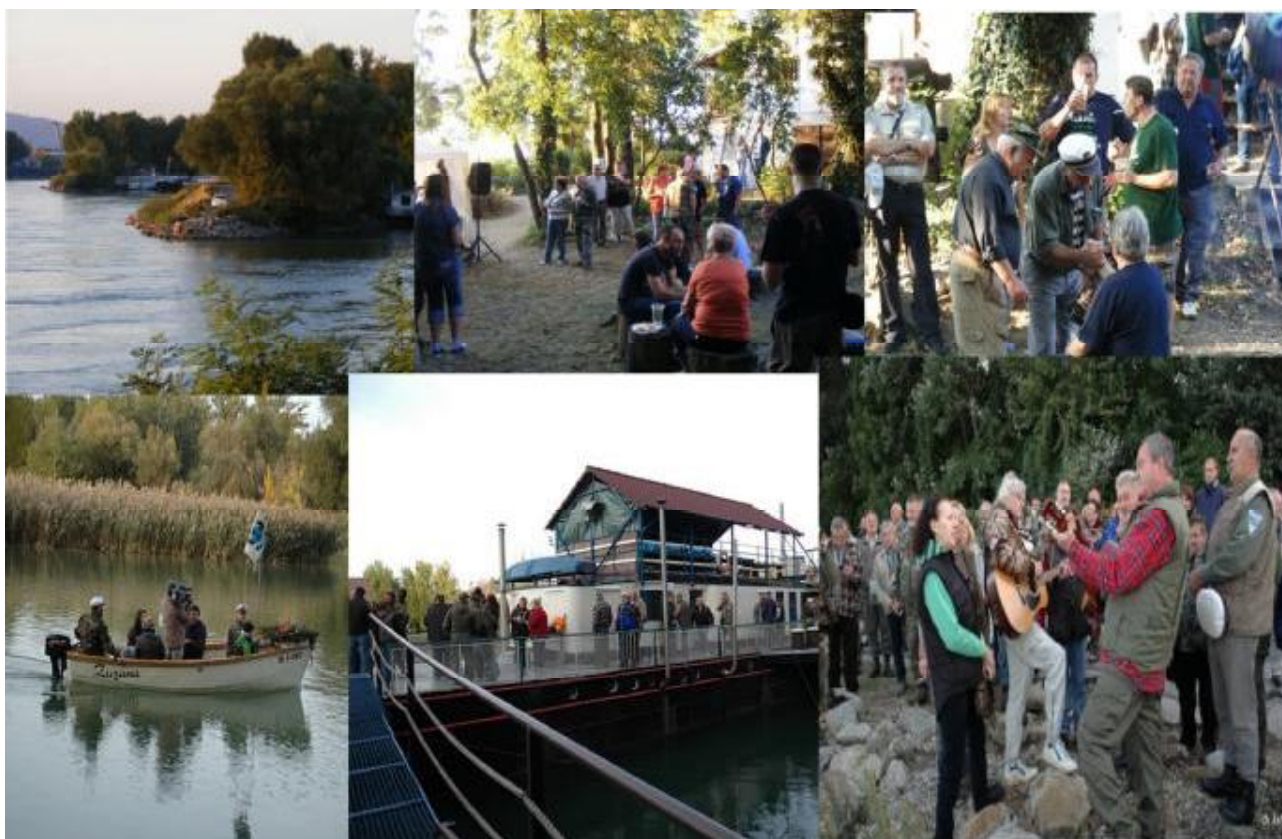
50. výročie založenia lodenice Figaro – Kormorán, Admirálska kotva.