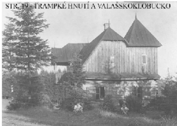
Chata na Stráži postavena ve třicátých letech na rekreační účely. Vyhořela r.1935