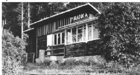
Chata Miranka - postavená r.1939 osadou Naděje