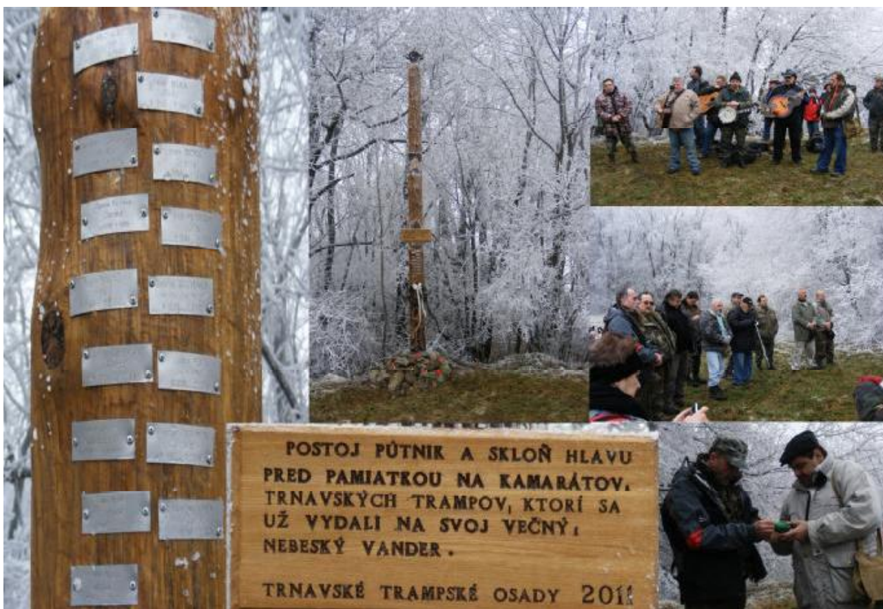
Zo spomienkového stretnutia pod hradom Korlát 26. novembra 2011.