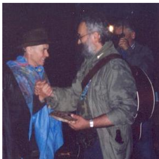
STR. 20 – TRAMPSKÉ HNUTÍ A VALAŠSKOKLOBUCKO