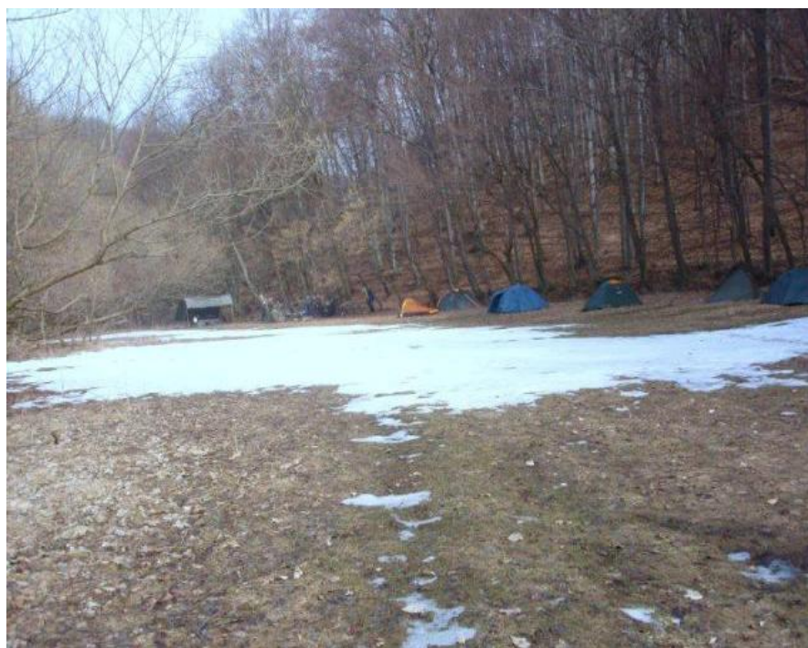
Táborisko – lúka Sklené Hute

Rozosieval žeravé iskry k oblohe, sme aj my mysleli na kamarátov, čo tiež táboria