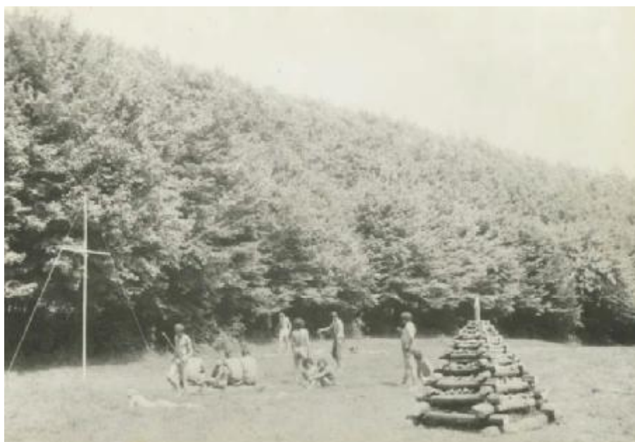
Foto z príprav sleziny v r.1975

s kamarátni T.O. Zálesák spoločnú slezinu, na ktorú prišli kamaráti z osád Utah, Perero, Estakádo, Šedý Grizly, Jastrab, Zlatá podkova, Strieborná ruža, Skarabeus, Severka, Cariboo, Čierny Medveď, Mexico, Veľká Medvedica, Škared'áci, Cherokee, Teekome, Desperádo, Kalgari, Alabama, Túlaví Vlci a ďalšie osady. Sleziny sa zúčastnilo cca 120 trampov. Po rokoch sa pomaly začala osada rozpadáť niektorí