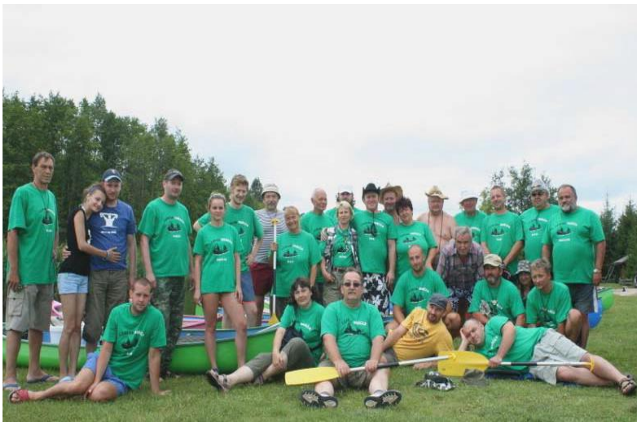
Druhý tábor : Buda Ruska – spoločné foto

Keď už sme boli tak zafúkaní, že sme mali pocit, že bližšia cesta ku kláštoru bude cez rákosie ako po jazere, vrátili sa „šamanovi mladí“ a oznámili nám, že zvyšné posádky sú zachránené, tak sme sa pobrali vodnou cestou ku kláštoru. Cesta nebola značená, samozrejme že sme poblúdili a pri kláštorom móle sme urobili prieskum. Našich sme však nenašli a keďže nás tlačil čas, oželeli sme prehliadku kláštora Camedolite a odbočili sme z jazera Wigri okolo poloostrova Czerwony Folwark do jazera Postaw a odtiaľ priamo do Czanej Hańcze, ktorá nás priviedla až do prvého táboriska. Cestou sme