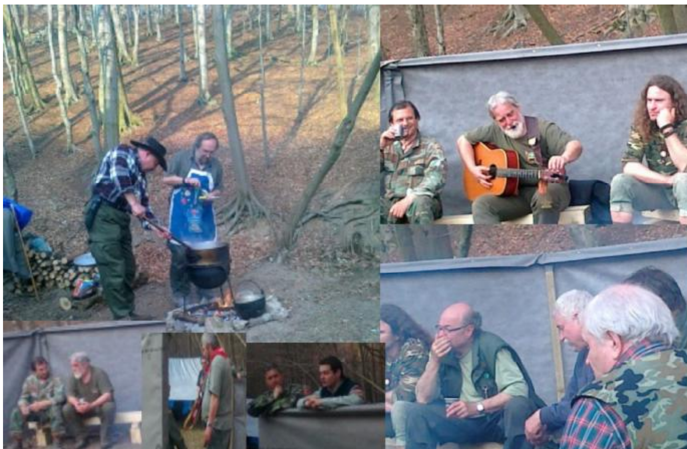
Vítanie jari Sklená Huta 2012.