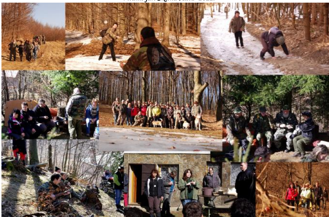
8. marcový pochod 2012.

© Vydalo: Regionálne tramské združenie – Pezinok pre vnútornú potrebu združenia.