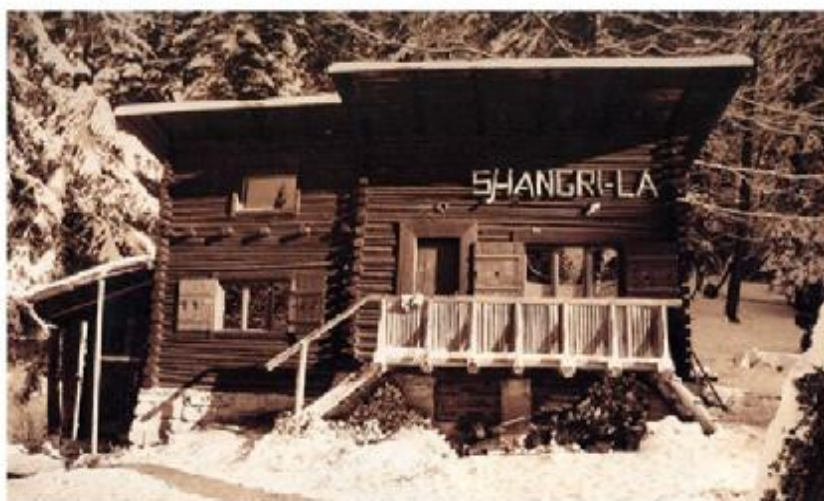
STR. 33 - TRAMPSKÉ HNUTÍ A VALAŠSKOKLOBUCKO