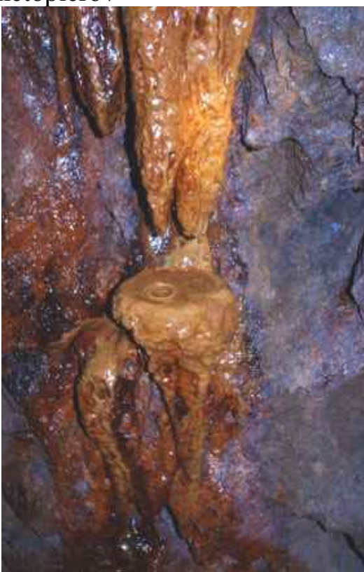
Našlo sa i mini jazierko na stalagmite