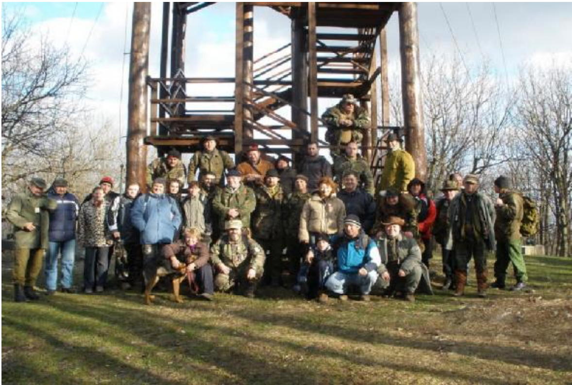
Společné foto Štefanský šlapáček 26.12.2009.