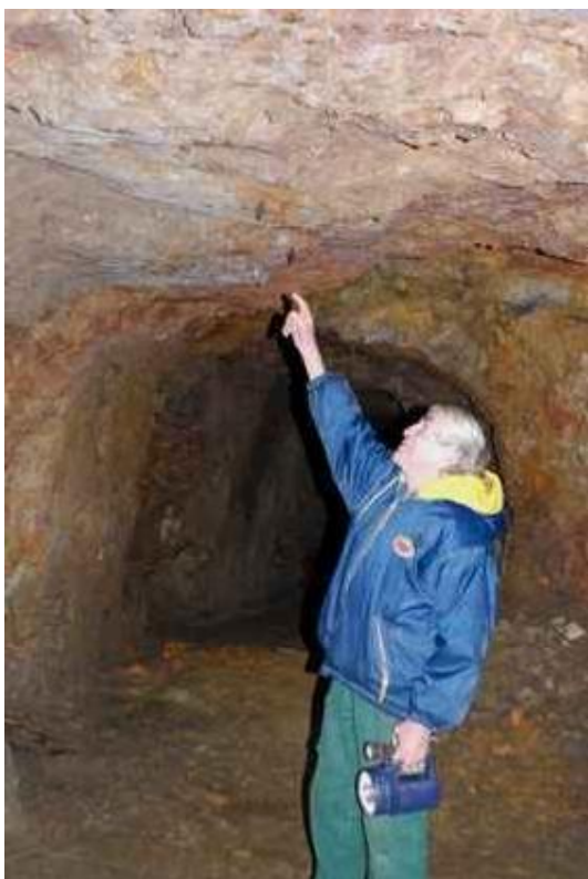
Krivý našiel v štrbine dvoch netopierov