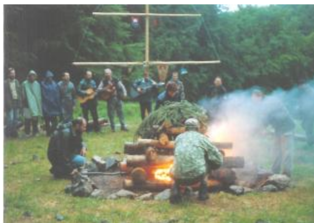
Potlach 20. výročie založenia osady Vysoká M- Karpaty