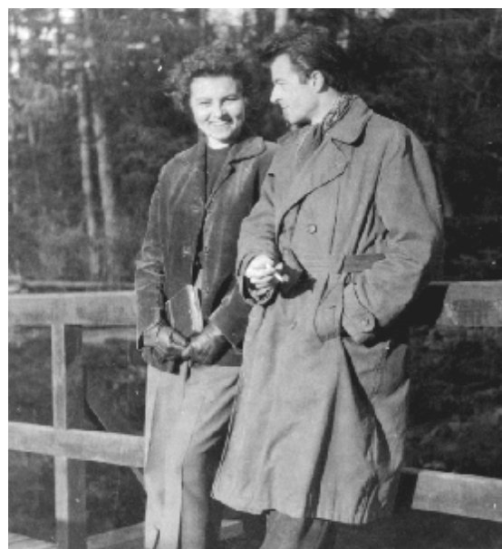
To je ona.

Podářilo se – až na to, že krásnou dámu jsem nabalil já; byla z Liberce, jezdil jsem pak za ní na kole o víkendech, potrampsku přespával v lese v Lidových sadech... a když nám nějaký čas nato zrušili výrobu ve strašnické „ogarce“ a rozehnali nás do všech stran, odešel jsem z Prahy do Liberce za svou láskou – která se se mnou týden nato rozešla. A to jsem pro ni napsal nejmíň tři písně. C'est la vie!