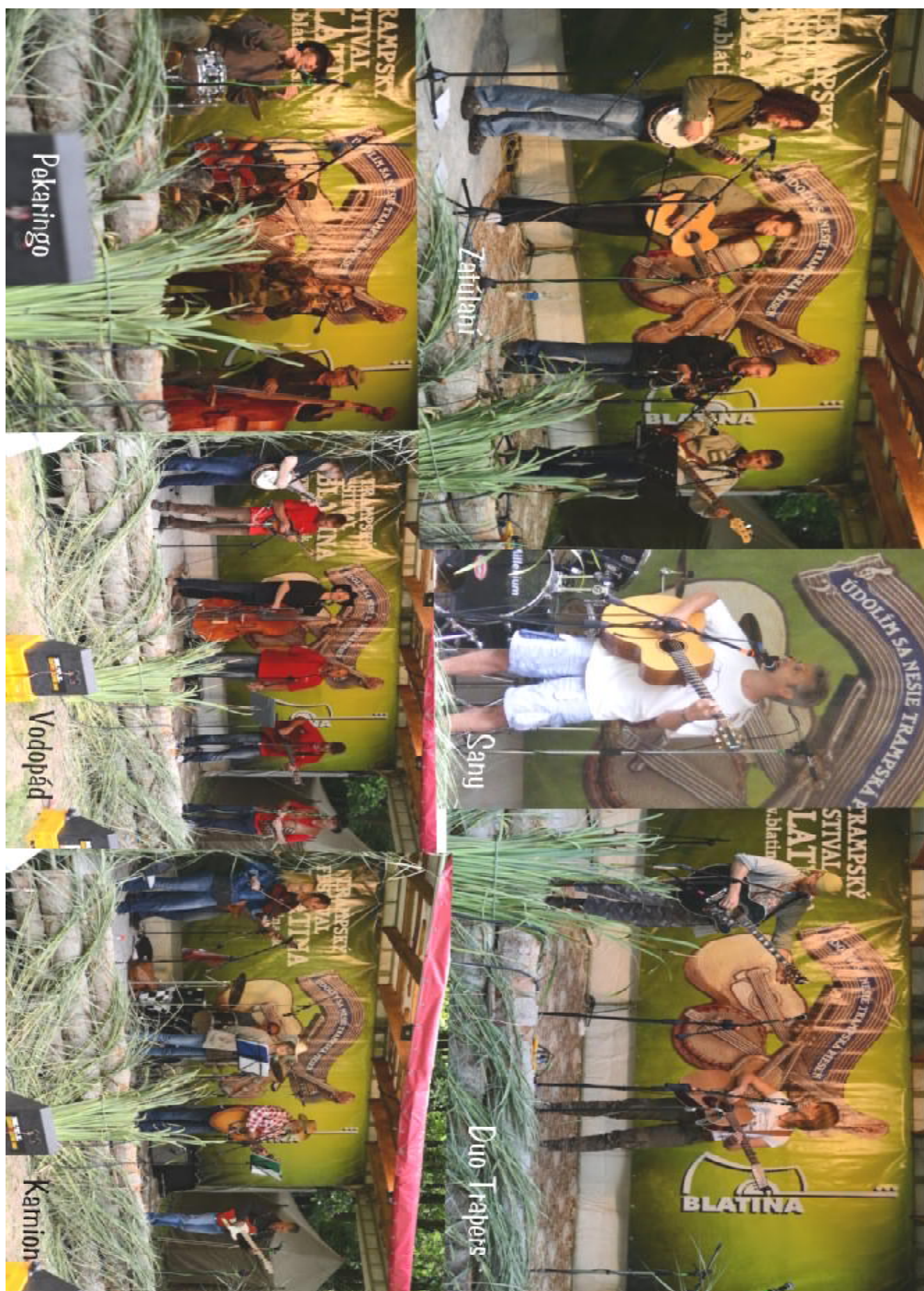
Foto: kapely z vystúpenia - Festival Blatina – ... údolím sa nesie tramská pieseň...

© Vydalo: Regionálne tramské združenie – Pezinok pre vnútornú potrebu združenia. Na tvorbe tohto čísla spolupracovali kamaráti, Rendy, Lewis, a ďalší. Predpokladaná uzávierka budúceho čísla 18.11.2015. Kontakt: email: malokarpat.obcasnik@gmail.com