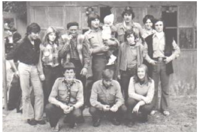
foto z vandra na potlachu Bielych vlkov z Gajar osady: Zlatý sup, Mexico, Zálesák z Pezinka, TO. Storm z Bratislavy

Domovenku mali s bleskom a nápisom TO. STORM, nezachovala sa.