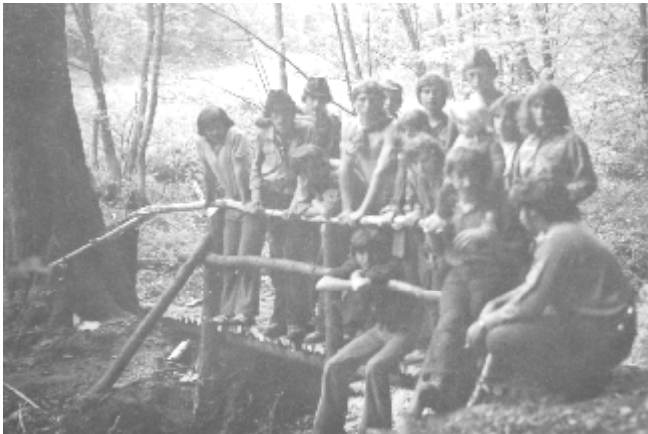
foto: jedna z opráv lávky tzv. chytřím chodníkom na starú nemeckú cestu.

Na prvý veľký vander sa vybrali do Vysokých Tatier do Tatranskej Lomnice roku 1972, ktorého sa zúčastnili Samson, Cica, Cigáň. O rok neskôr to bol vander