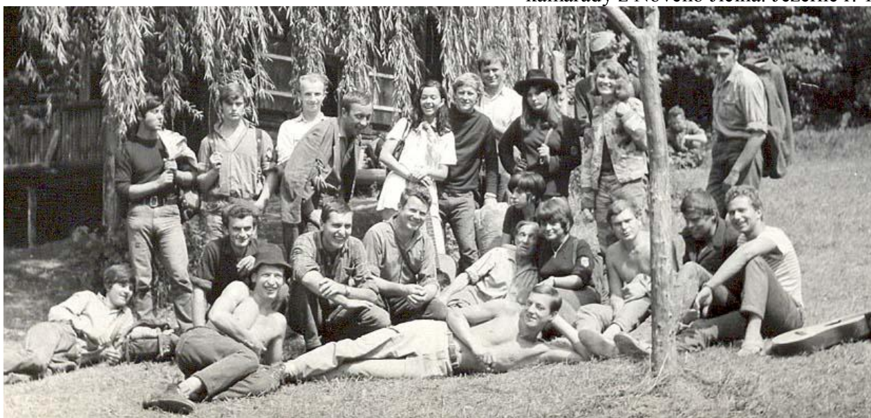
Z druhého potlachu klobuckých trampů r. 1967