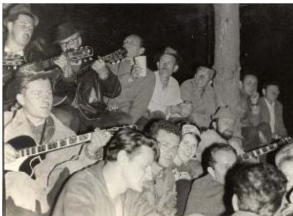
Jezerné – Velké Karlovice r. 1965