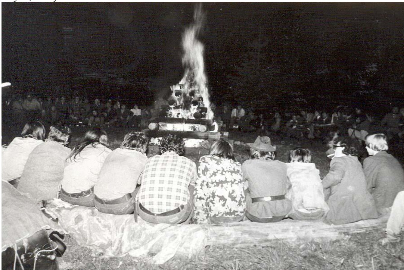
Devátý oheň klobuckých trampů r. 1975