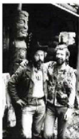
Mekie z Litomyšle a Tajman