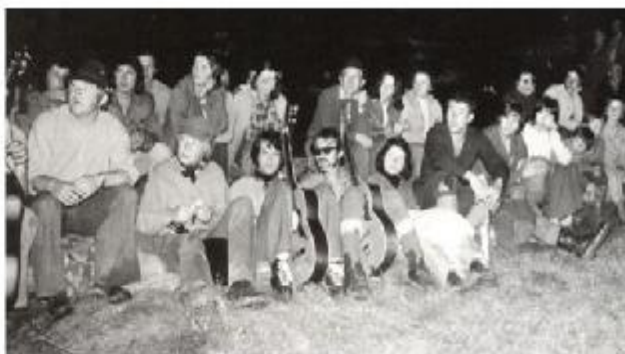
Devátý oběť SKO r. 1975