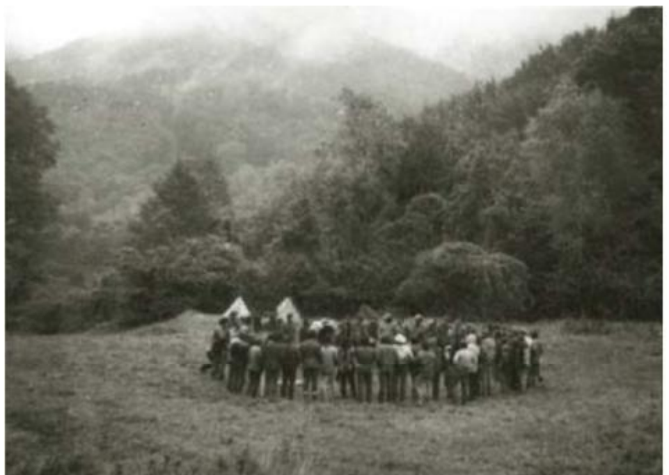
Prvý potlachový oheň trampskej osady BIELI SUPI, v dolinke nad Sološnicou, v septembri 1972.