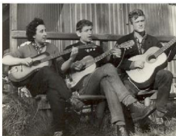
Pavouček, Tajman a Slon