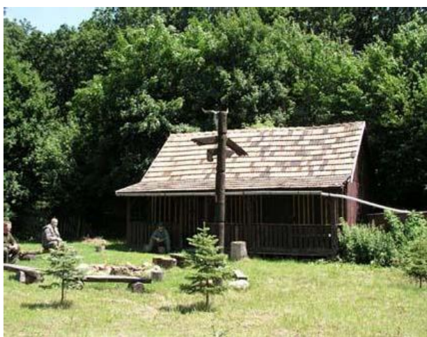
Chata a totem tramskej osady Biela Tesák