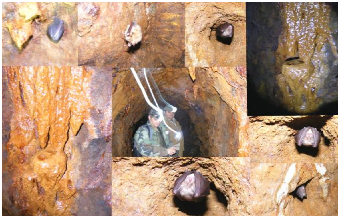
Ilustračné foto: Niekoľko záberov z podzemia zo sčítania netopierov 2012.

V nedeľu 16.decembra 2018 boli členovia Regionálneho tramského združenia – Pezinok v jednej nemenovanej starej banskej štôlni v Malých Karpatoch nad Pezinkom počítat' zimujúce netopiere. Žiaľ k sčítaniu netopierov sme sa vôbec nedostali. Ako sme už v minulom roku uviedli, z do starej štôlni sa okrem netopierov našahovali aj feľaci, ktorí začali odpadmi znečisťovať štôlu, tak sme sa ďalej do vnútra nedostali združenie baníkov v Pezinku začalo s úpravou vchodov do banských diel v Malých Karpatoch. Oslovili sme aj členov, ktorí sa o banské diela starajú v rámci združenia baníkov a pre nedostupnosť sme sa rozhodli, že pre tento rok od sčítania netopierov upustíme.