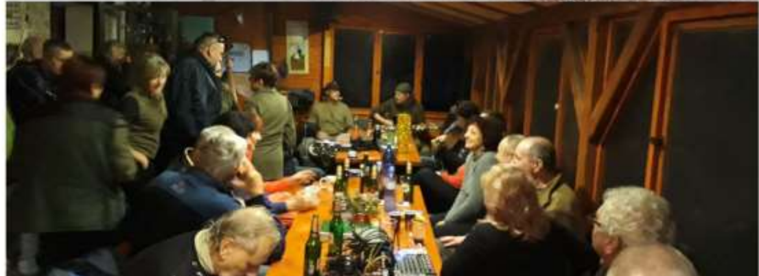
Trojkrálový pochod TO Pohoda - 5. ročník (str. 7)