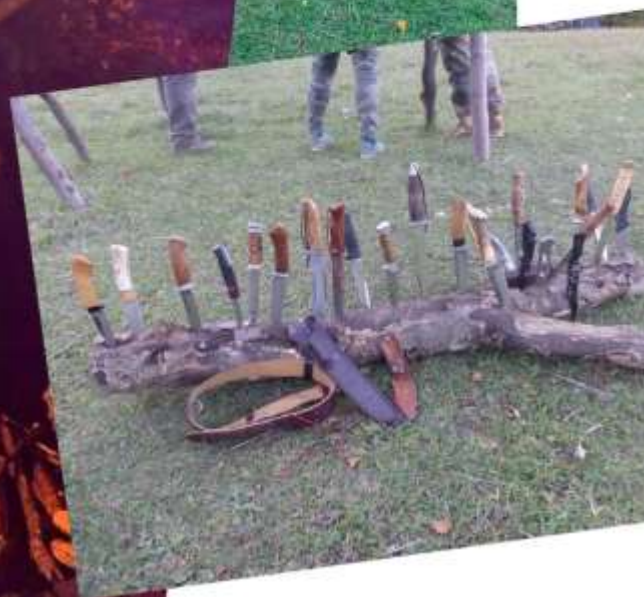
Nočný prechod, (str. 10)