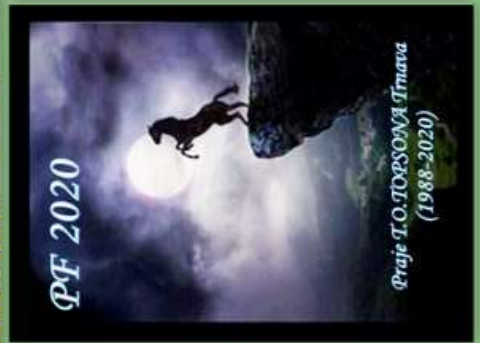
Koláž vytvoril: Džipo