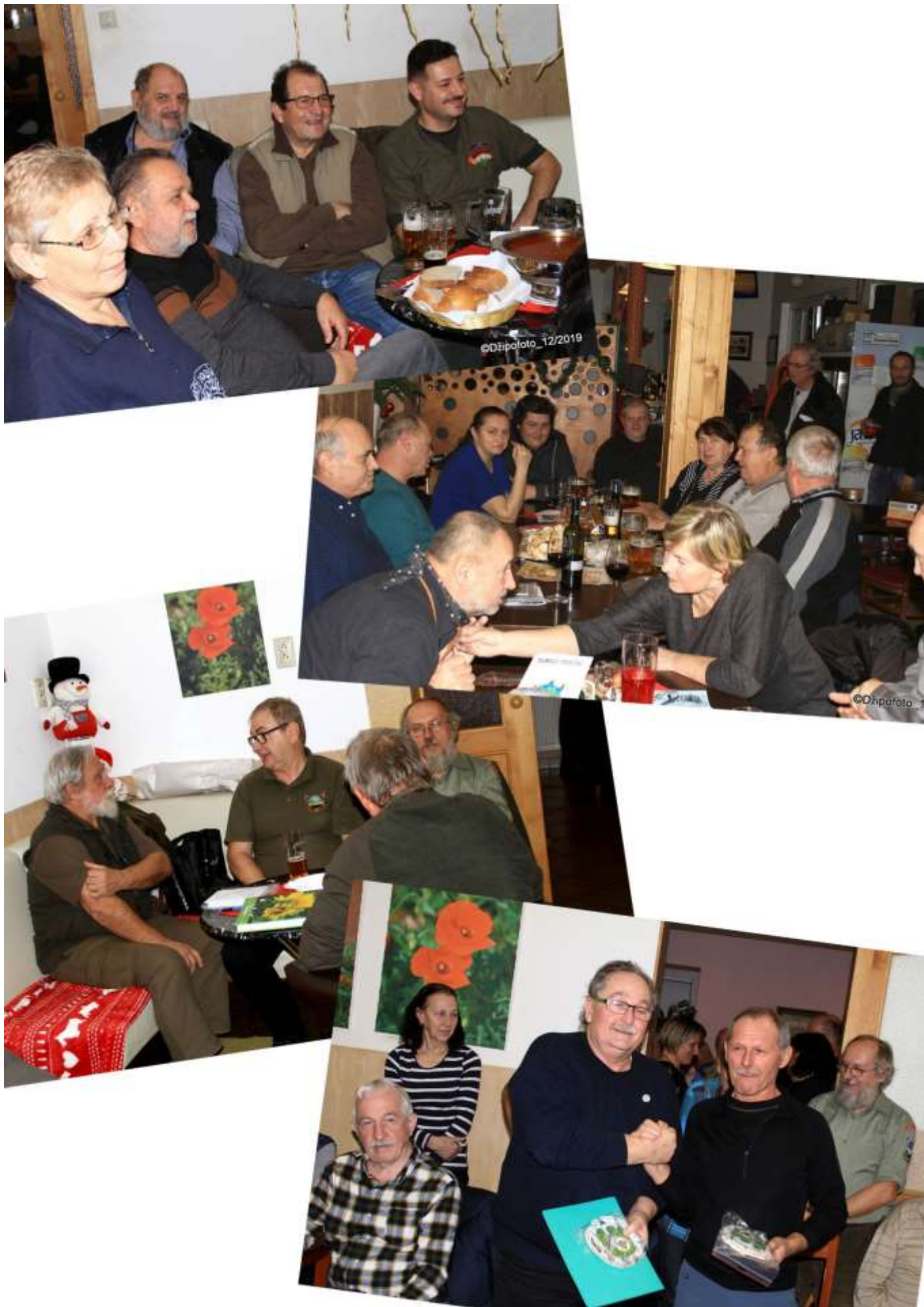
Decembrové stretnutie Tramp klubu Bratislava (str. 5)