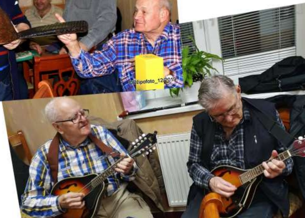
Decembrové stretnutie Tramp klubu Bratislava (str. 5)