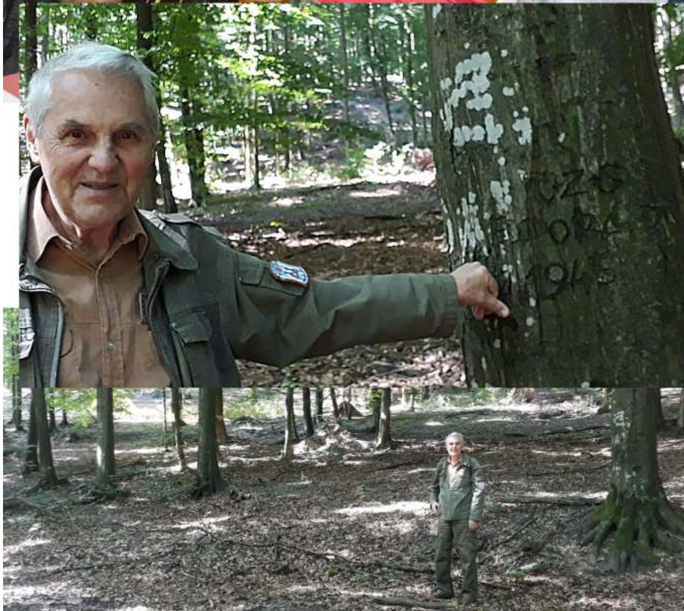
TO Eldorado 1945 – 75. výročie založenia osady, (str.15)