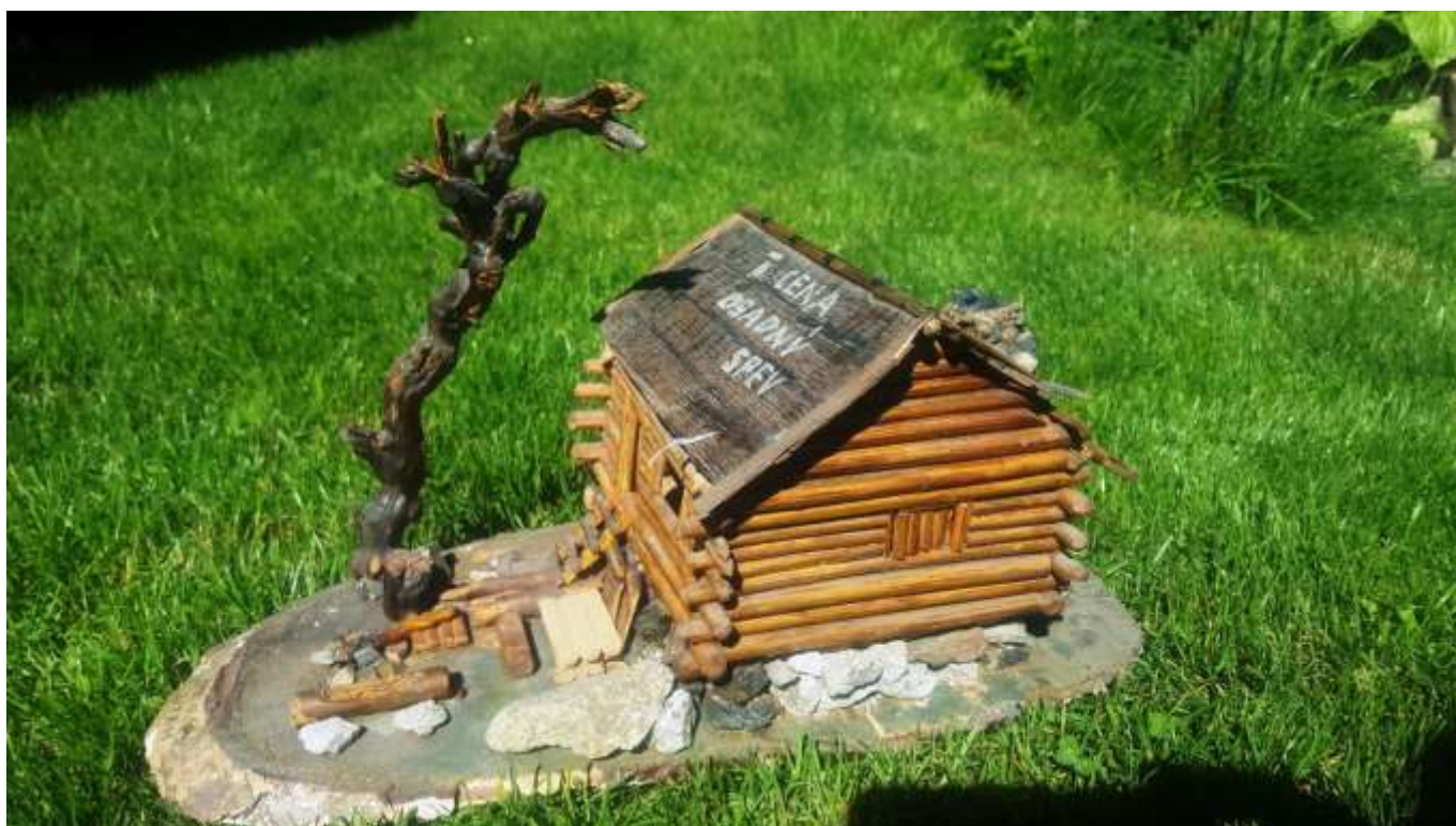
Cena za III. miesto v Osadnom speve na potlachu k 20. výročiu TO Manila v r. 1967, (str. 1)