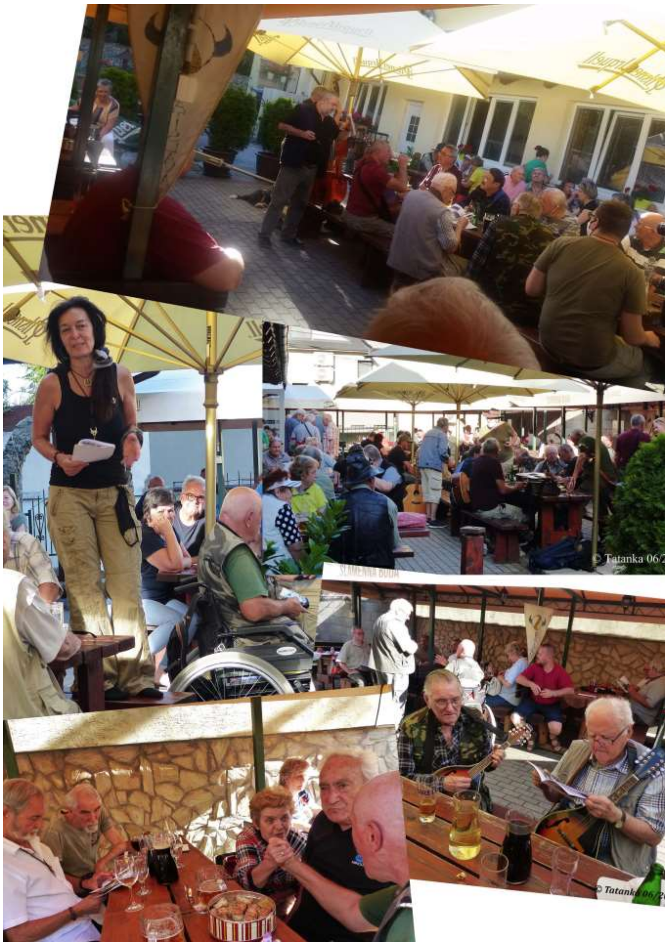
Júnové stretnutie TCB, (str. 8)