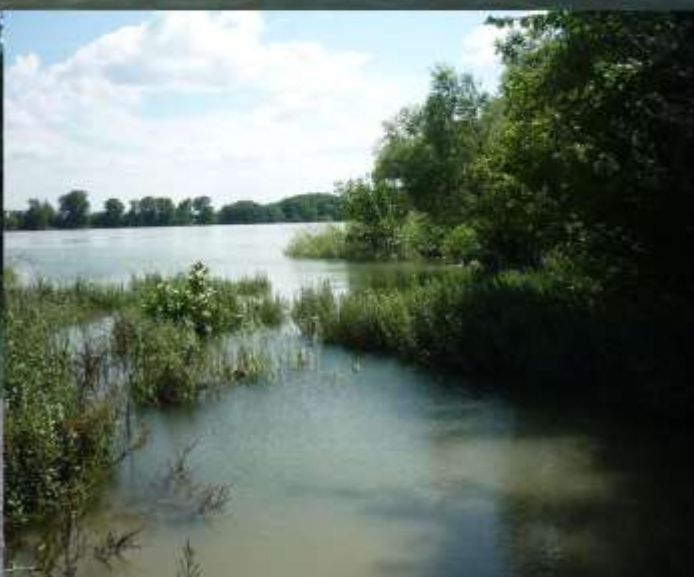
Splav Dunaja, (str. 10)